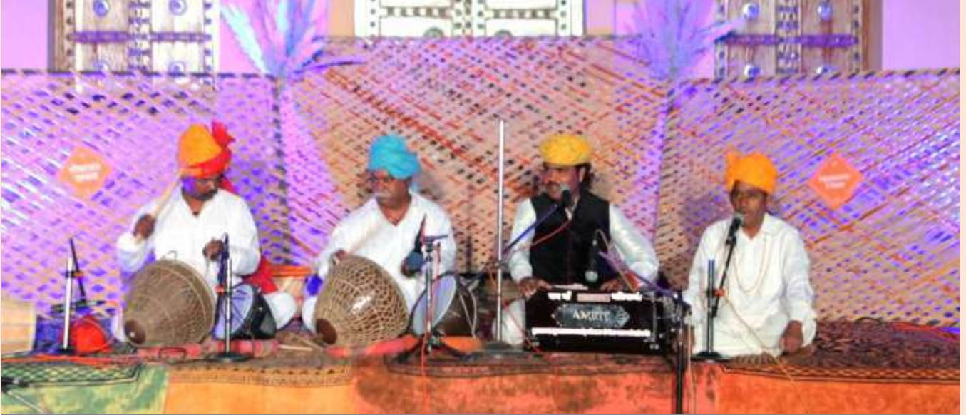
Ravanhatta Performance by Bhopa-Bhopi Group